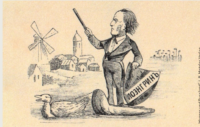
„Wagner und Russland“, J. B. Metzler Verlag